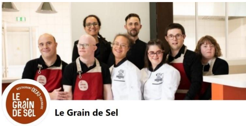
Le Grain de Sel

d'un représentant de la préfecture, d'un représentant du Conseil Départemental, d'un adjoint au maire de la ville pour les affaires sociales et du représentant régional de la SNCF pour l'aménagement des gares.